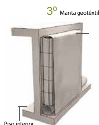
● Representação 2D da construção de cortina drenante em parede enterrada

produzido por PREVICON Sob licença Saint-Gobain Weber Portugal, S.A.